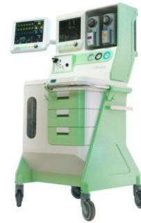
Mehrzweckgerät für Inhalationsnarkotika MAIA-01