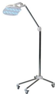
Bestrahlungsapparat für Phototherapie