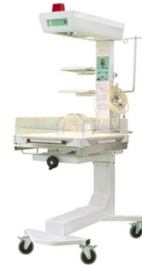
Neonataler Tisch SNO