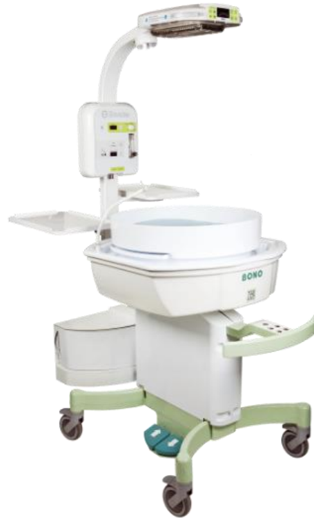
Offenes Reanimationssystem ORS-BONO