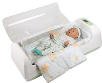
Tragbarer Inkubator für Neugeborene BONNY