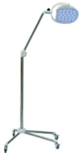
Bestrahlungsapparat für Lichtbehandlung