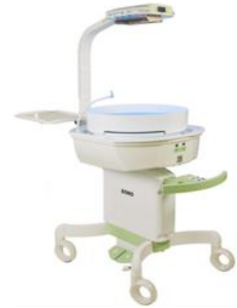
Neonataler Tisch SNO-BONO