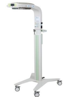
Neonatale Wärmelampe "Radiant heat"-BONO, in 2017 in Produktion gegangen